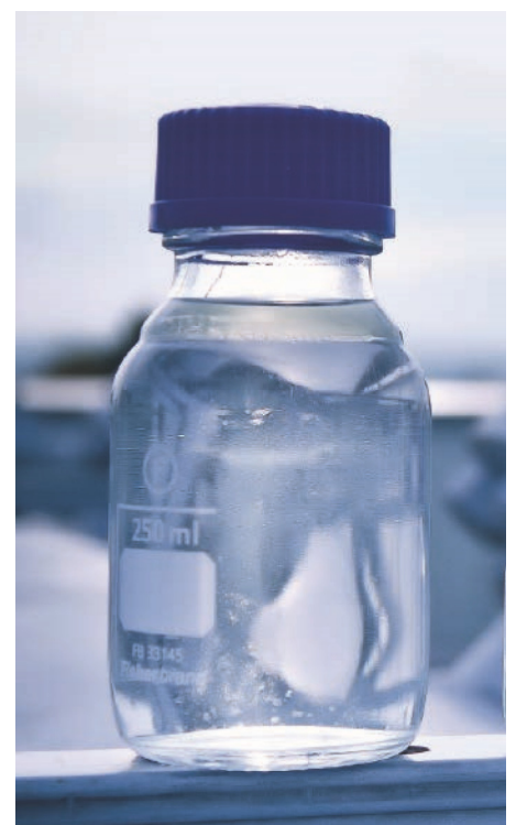
Aus Ökostrom, Wasser und CO 2 synthetisch erzeugt: treibhausgasneutraler flüssiger Energieträger.

Was es dazu braucht, ist Power-to-X (PtX), also die Umwandlung von elektrischer Energie in Kraft- und Brennstoffe, wobei das X für „Liquid“ oder „Gas“ steht. Erdöl und Erdgas werden also nicht abgelöst durch die direkte Nutzung von Sonne, Wind, Wasser und Biomasse. Der Strom, den diese erneuerbaren Energiequellen liefern, wird vielmehr genutzt, um alternative flüssige und gasförmige Energieträger, sogenannte E-Fuels, zu erzeugen. Mithilfe des grünen Stroms wird in Elektrolyseanlagen Wasserstoff gewonnen. In einem →