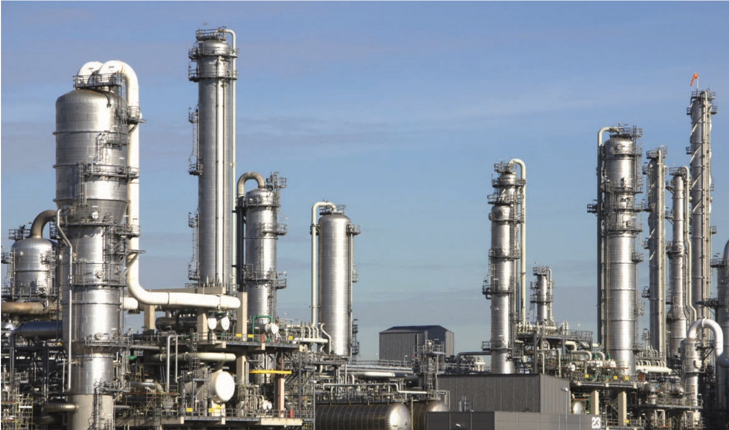
Bis 2050 könnte der Leistungsbedarf von Elektrolyseuren, Methanisierungsanlagen sowie Reaktoren zur Herstellung flüssiger Kraft- und Brennstoffe ca. 8.000 Gigawatt betragen. In Deutschland sind derzeit rund 100 Gigawatt an Solar- und Windkraft installiert.

Reaktor reagiert dieser mit Kohlendioxid. Je nachdem, wie diese Reaktion abläuft (Methanisierung, Methanolsynthese oder Fischer-Tropsch-Synthese), entstehen chemische Energieträger wie Methangas, Methanolalkohol oder synthetische Kraft- und Brennstoffe, deren Eigenschaften mit denen von heutigem Benzin oder Diesel vergleichbar sind.